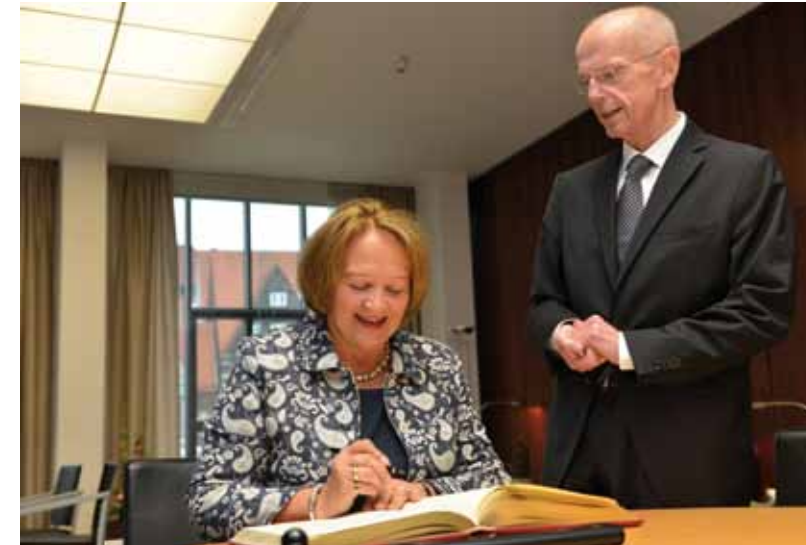
Festrednerin Sabine Leutheusser-Schnarrenberger schreibt ins Gästebuch der Bremischen Bürgerschaft: »70 Jahre bremische Verfassung bedeuten Auftrag und Verpflichtung. Die Verfassung von Bremen ist vorbildlich und zukunftsorientiert.«

Sabine Leutheusser-Schnarrenberger ist Bundesjustizministerin a. D. und FDP-Politikerin.