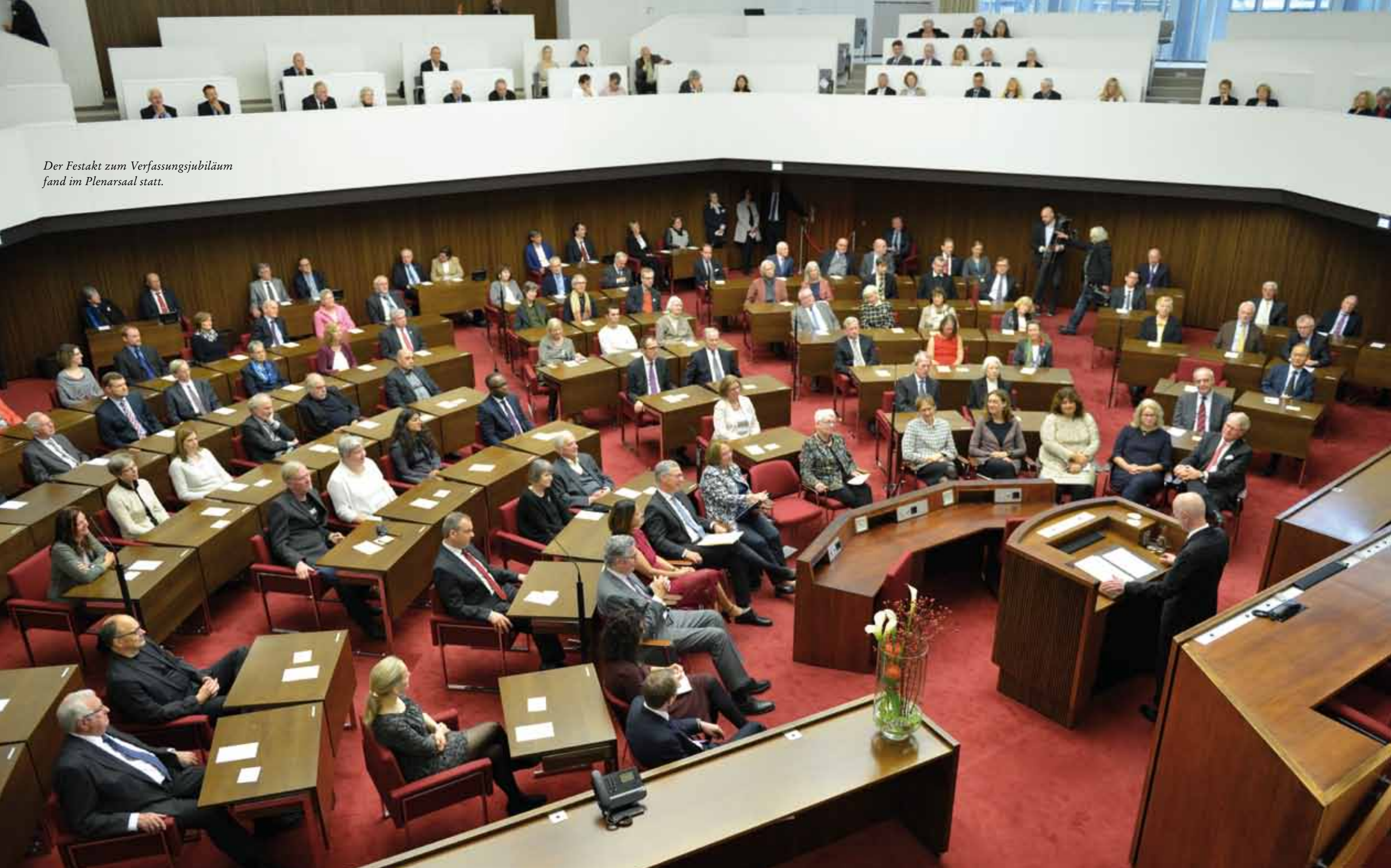
Der Festakt zum Verfassungsjubiläum fand im Plenarsaal statt.