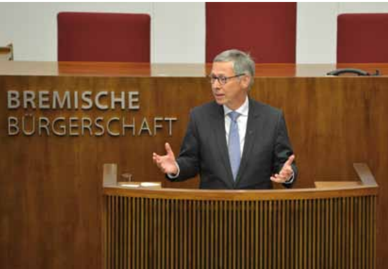
Bürgermeister Dr. Carsten Sieling

Wir sind hier heute zusammengekommen, um im Rahmen einer Festveranstaltung das 70 jährige Bestehen der Verfassung der Freien Hansestadt Bremen zu begehen. Vor siebzig Jahren war nicht zu erahnen, was aus dem in Trümmern liegenden Land Bremen werden würde und welche Entwicklung es nehmen wird. Dieses Jubiläum bietet Anlass, um sich, nach dem Untergang des nationalsozialistischen Unrechtsregimes, kurz die damalige Situation in Erinnerung zu rufen.