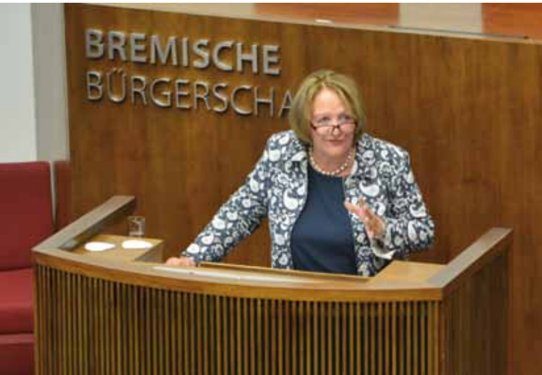
Sabine Leutheusser-Schnarrenberger erntete viel Beifall für ihren Vortrag.

Ich bedanke mich für die überaus ehrenvolle Aufgabe, die Verfassung der Freien Hansestadt Bremen 70 Jahre nach ihrer Entstehung im Rahmen eines Festaktes zu würdigen. Es handelt sich um eine bemerkenswerte und bis heute in einigen Aspekten einmalige Verfassung, die 1947 im zerbombten Nachkriegsdeutschland von den Abgeordneten der Bremischen Bürgerschaft und den Bürgerinnen und Bürgern mit großer Weitsicht beschlossen wurde. Das zeigt sich allein schon daran, dass es zwar in den letzten 70 Jahren auch Änderungen der bremischen Verfassung gab, aber doch relativ wenige, die sich unter anderem mit einer Stärkung der Freiheitsrechte wie die Durchsetzung der Gleichberechtigung, der Verankerung eines Benachteiligungsverbot, ein eigenes Kindergrundrecht und dem Datenschutz befassten. Weiter musste die Verfassung natürlich an die Europäisierung und an die Föderalismusreform angepasst werden. Blickt man auf die über 50 grundgesetzlichen Änderungen in 68 Jahren, dann erweist sich die heute vor genau 70 Jahren angenommene bremische Verfassung sehr wohl als zukunftsorientiert. Nur am Rande sei bemerkt, dass eine